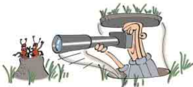
Nach mehreren gescheiterten Versuchen, gelang es Ameisenforscher K. zwei heftig kommunizierende Ameisen fotografisch festzuhalten.

Das Lösungswort der letzten Ausgabe war: AIRPLANE